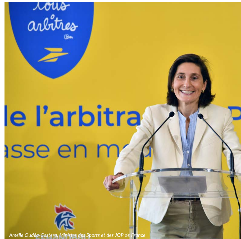
Amélie Oudéa-Castera, Ministre des Sports et des JOP de France